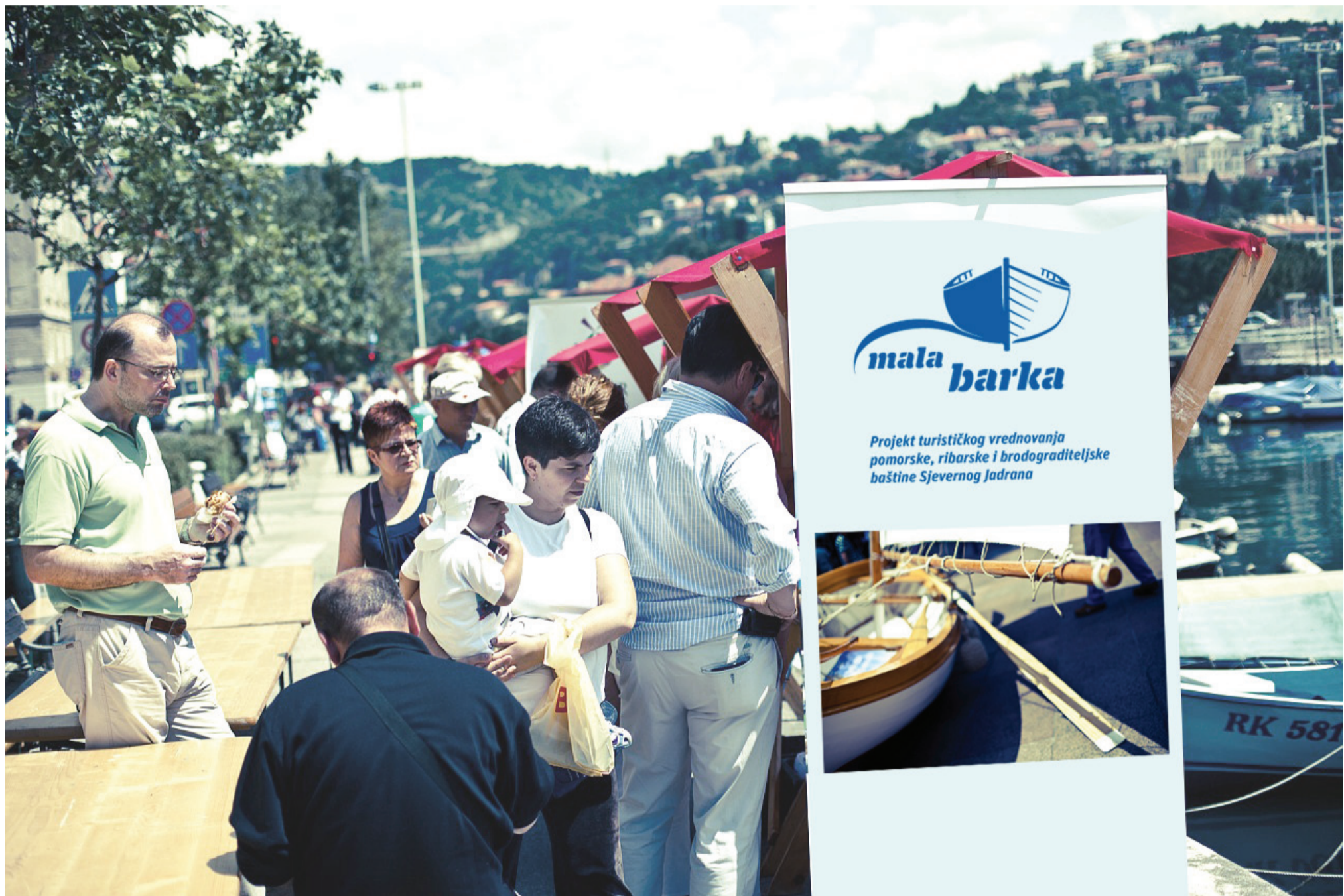
aplikacija - roll up