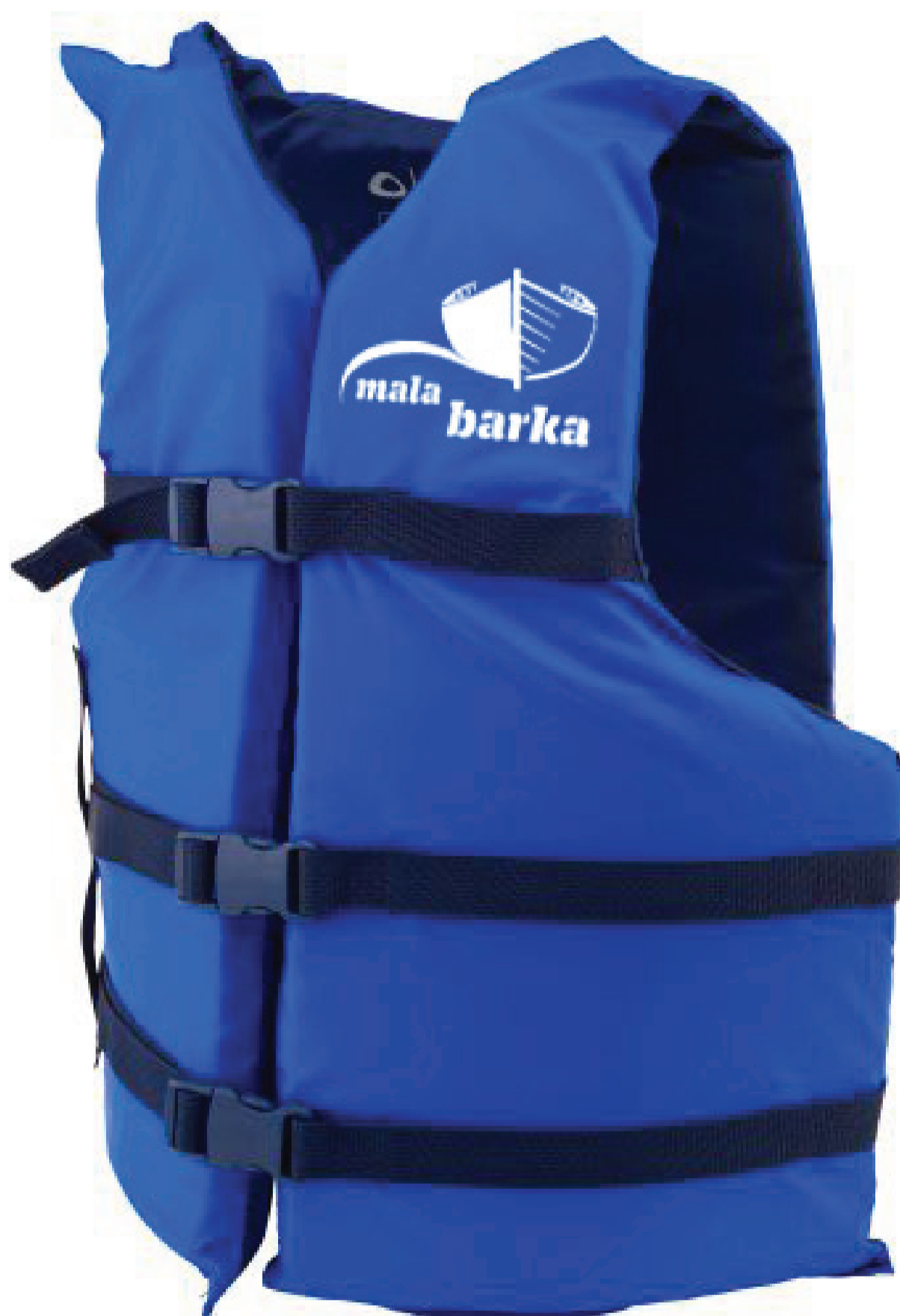
aplikacija - life vest